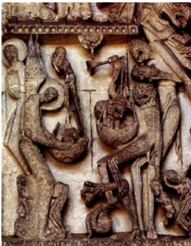
El pesaje de las almas (detalle del Juicio Final). Tympano de la portada. Catedral de San Lázaro, de Autun (Saône-et-Loire), Francia (siglo XII)

Como dice san Pablo, los pecados de carne son fáciles de percibir. Mientras que aquellos que, a causa de su soberbia, se creen buenos lejos de toda oportunidad de enmienda, salvo la llamada de nuestro Señor que siempre está a la puerta del corazón del hombre y llama a golpes. A Dios le suplico que lo escuchemos y lo